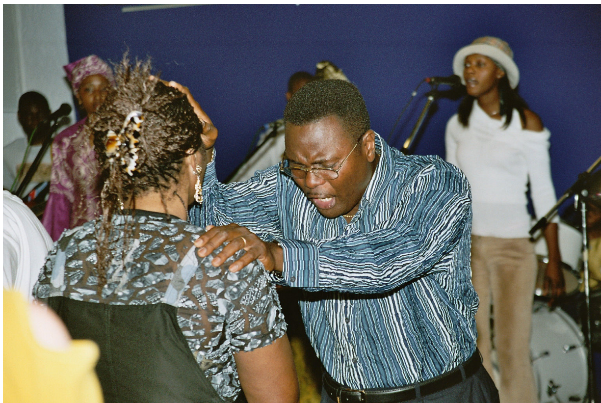
Fürbitte im Gottesdienst

Der Pfarrer und einer der Responsables der Église Vineyard Francophone treten je zu einer Person hin. Kiakanua steht bei einem jungen Mann in breiten, modischen Hosen und Baseballmütze. Dieser flüstert ihm etwas ins Ohr. Der Pastor legt ihm eine Hand auf die Schulter und beginnt engagiert für ihn zu beten. Obwohl er nun laut spricht, erfährt niemand, warum ihn der Mann um Unterstützung durch ein Gebet gebeten hat. Der Lärmpegel ist zu hoch, die einzelnen Mitglieder der Kirchgemeinde beten ebenfalls laut, die Band spielt eine rockige Melodie mit viel Schlagzeugeinsatz. Nur Wortfetzen der Gebete, «au nom de Jésus», und immer wieder «au nom de Jésus», dringen trotzdem durch.