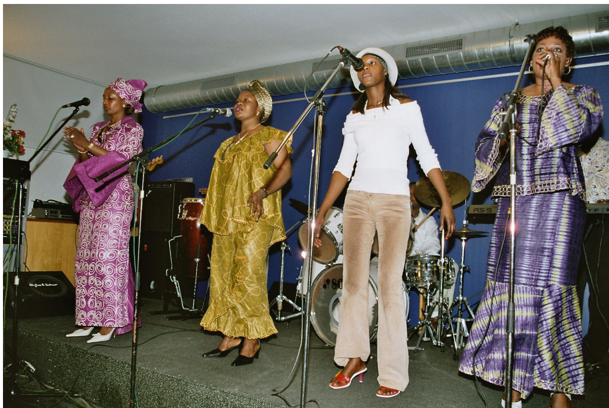
Auftritt der Groupe de Louange

Die Sängerinnen und die Musiker nehmen Stimmungen auf. Wenn die Stimme des Leiters der Adoration et Louange anschwillt, dann findet die Groupe de Louange lautere Töne und Melodien. Neigt sich eine Gebetssequenz ihrem Ende zu, wird die Musik leiser.