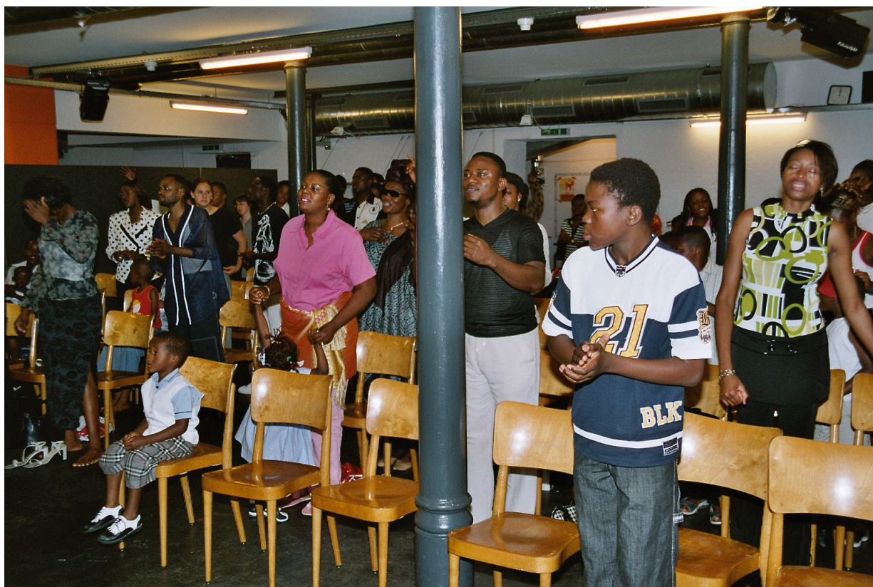
Nägeligasse 11, Église Vineyard Francophone

2002 zog Basileia Vineyard - und mit ihnen die Église Vineyard Francophone - um (M1A09). Basileia Vineyard mietete den Raum im Untergeschoss an der Nägeligasse 11 für die Église Vineyard Francophone (vgl. E1R79). Vermieterin ist das evangelische Gemeinschaftswerk (EGW).