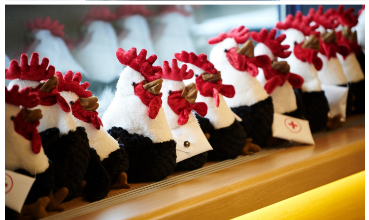
Die Kirchturm-guggel Bejusos warten auf Käufer und Käuferinnen