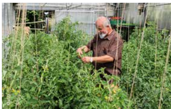
Der Gärtner in seinem Gewächshaus und sonntags als Prädikant am Predigen.

Ich orientiere mich meist an den Perikopen der EKD und somit am Kirchenjahr. Ich finde, die