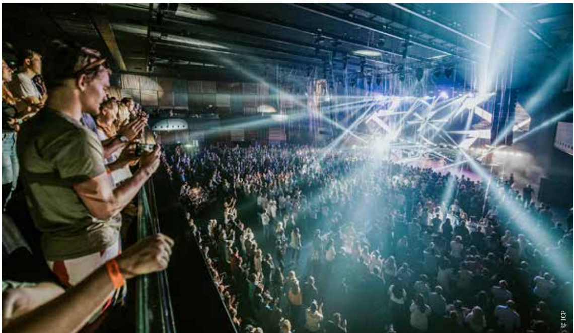
ICF-Gottesdienst: Ein multimediales Ereignis.

Mit der Eventkultur antworten die ICF Churches auf den Individualismus unserer Zeit. Sie bauen nicht auf Tradition oder Pflichtgefühl, sondern auf die persönliche Motivation, Teil einer