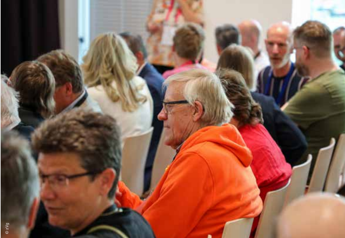
Gut besuchter Jahreskongress christlicher LGBT- Organisationen.